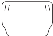
Ośłona PET 0,5 mm